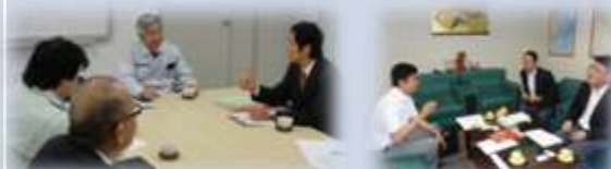
③海外展開支援窓口設置(11月1日)