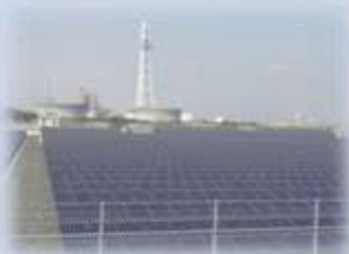
メガソーラーたけとよ