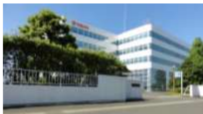
緊急避難地として協力戴ける企業