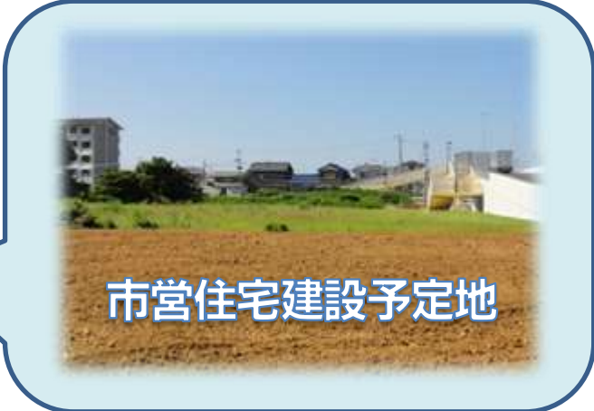
市営住宅建設予定地

耐震基準に満たない老朽化した「花の山」、「新所原」、「上ノ原」市営住宅などの建て替えとして浜名病院南側に市営住宅(64戸)の新築を計画しています。