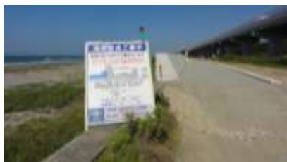
海岸改良中の白須賀海岸