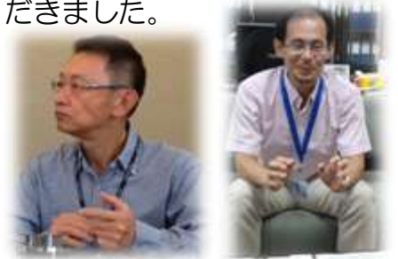
ジャカルタ工場団地 ジャカルタJETRO