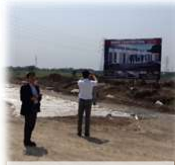
ジャカルタ工場団地開発

ハノイでは日系商社が開発した工業団地のレンタル工場を視察しました。団地内企業の賃金情報や規制など情報ネットワークが確立されており、 安心感 がありました。一方、外資系はコスト面では優位ですが、 情報不足が課題 です。先進企業の駐在員さんからも事前の情報収集と仕事量の確保が必要とお話いただきました。