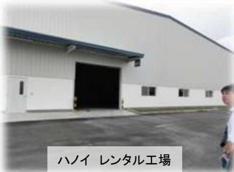
ハノイ レンタル工場

アンケート調査の中で進出検討先で多かった「ハノイ」と「ジャカルタ」へ現地視察に行ってきました。どちらもエネルギーで活気にみちみちており、これから彼らと戦うのかと思うと脅威さえ感じました。先進の企業9社、工業団地5カ所と日本貿易振興機構2拠点を訪問し、海外展開の課題と中小企業における海外展開への行政支援の可能性について聞き取り調査を行いました。