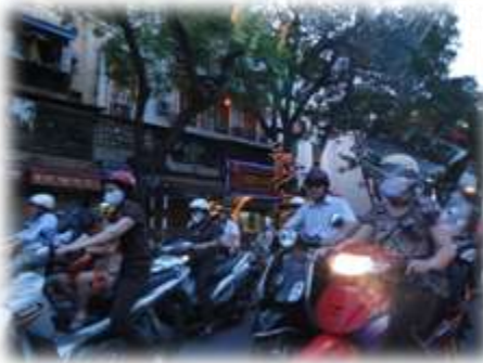
若者が溢れるハノイ市内