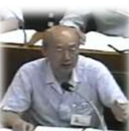
答弁する三上市長

市では財政状況を年2回公開している。前期の公表は前年10月1日から3月31日までを6月1日に公表、後期は4月1日から9月30日までの期間を12月1日に公表している。当年度事業の進捗は「定期監査」報告を市のホームページで公開する。また、昨年度の事務事業評価シートも外部評価と同時期、本年10月を目途に公開する。