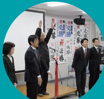
2期目の当選をさせていただきました。