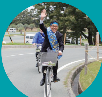
自転車でご挨拶に廻りました。