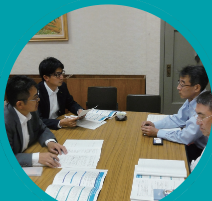
地域総合戦略について静岡県庁でヒアリングを受けました。