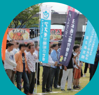
連合静岡湖西地域協議会メーデーに参加しました。