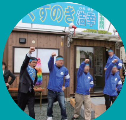
湖西市議会議員選挙が始まりました。