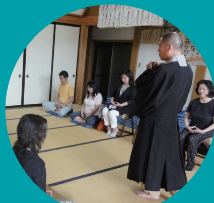
浜名湖おんぱくto新居に参加してきました。