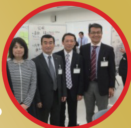
議会改革・自治体の 財源確保セミナー