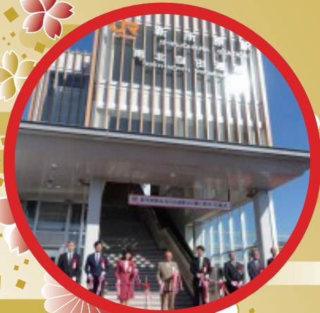
新所原駅自由通路橋上駅完成