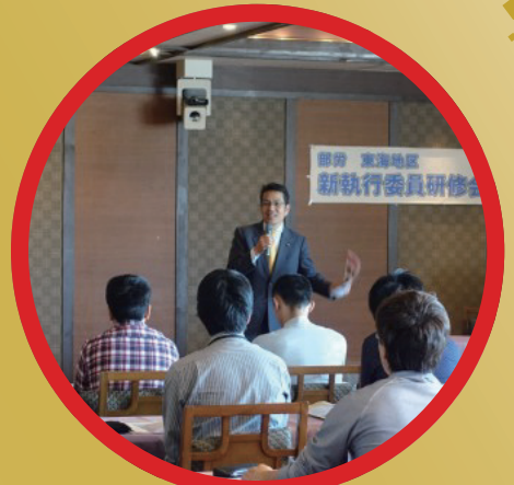
日産部品労連東海地区 執行委員研修