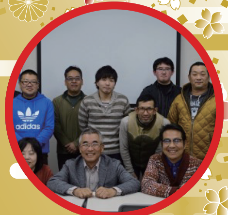
労働者自主福祉運動