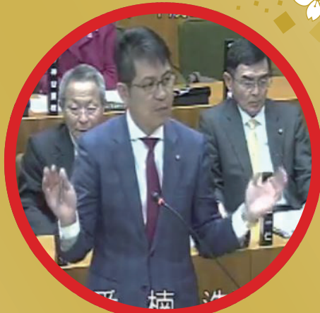
湖西市議会12月定例会2日目 一般質問