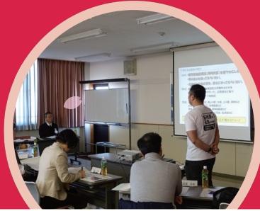
文化の香るまちづくり補助事業