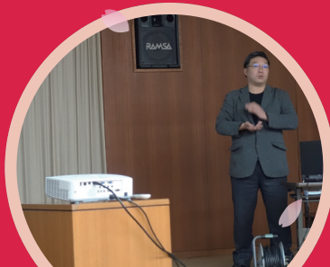
外国人対応出来るまちづくり