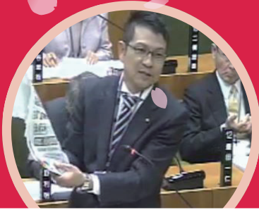
湖西市議会 3月定例会一般質問