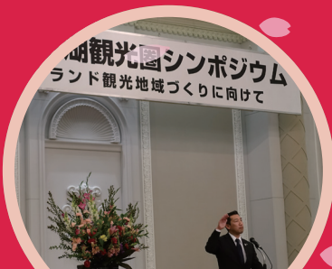
浜名湖観光圏シンポジウム