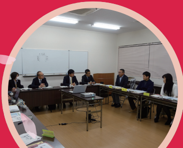
地域教育懇談会 @静岡県教職員組合湖西支部