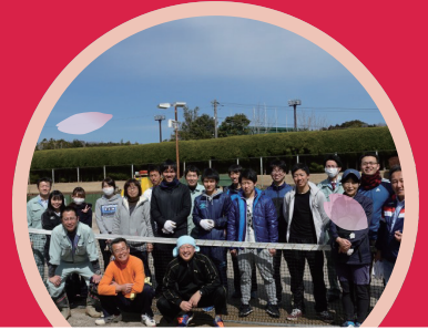
湖西市運動公園テニスコート整備