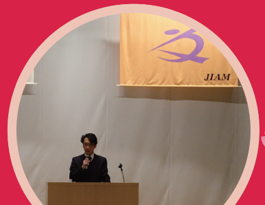
議員研修に行ってきました (自治体財政の見方)