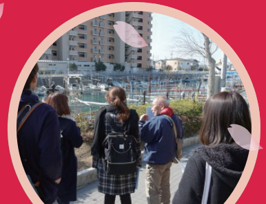
Habitat for Humanity Alicia