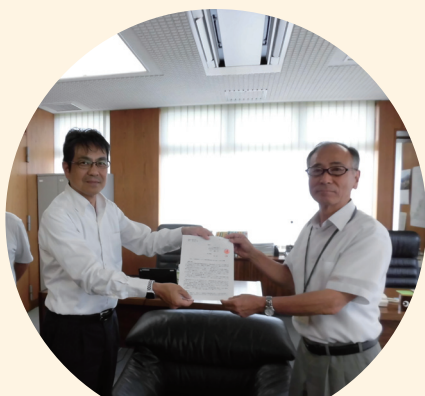
副議長へ請願書提出

自動車の購入、所有後にも重くのしかかる車体課税、ガソリン税などの自動車関係諸税の軽減と、2019年10月施行予定の消費税増税による、国内生産の落ち込みを防止すべく、自動車関係諸税の抜本見直しを求める請願を湖西市議会に提出し、10月3日本会議にて可決。意見書を作成して、国に提出しました。