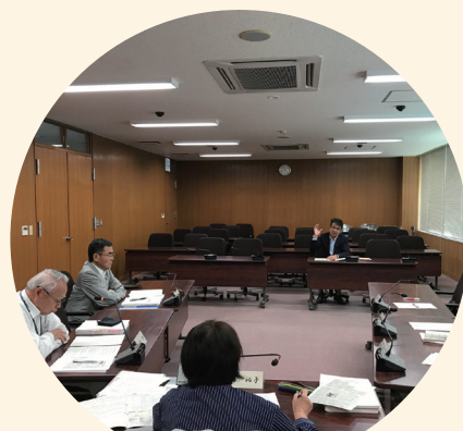
総務経済委員会請願審議

政 働く者の代表として 湖西で働いて良かった 策 住んで良かったと思える「魅力あるまちづくり」を目指します。