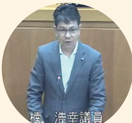
本会議請願書趣旨説明