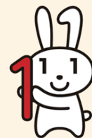
マイナンバー ※詳細はこちら